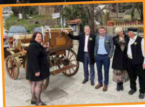
< Η άμαξα που θα μεταφέρει τη νύφη και τον γαμπρό.