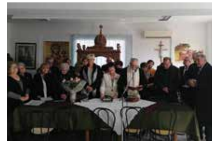
Από την εκδήλωση στον Άγιο Αντώνιο

Την πρωτοχρονιάτικη πίτα τους έκοψαν τα μέλη των ΚΑΠΗ Κάτω Σχολαρίου και Αγίου Αντωνίου την Κυριακή 12 Φεβρουαρίου 2023. Ο δήμαρχος Θέρμης Θεόδωρος Παπαδόπουλος κατά το σύντομο χαιρετισμό του σημείωσε πως «μας έλειψαν τα τελευταία χρόνια οι εκδηλώσεις μας λόγω της πανδημίας, ωστόσο αυτό αποτέλεσε μία καλή ευκαιρία να εκτιμήσουμε το ρόλο, τη χρησιμότητα και την προσφορά των δομών αυτών. Στο κομμάτι που μας αναλογεί ως δημοτική αρχή, σας διαβεβαιώνω πως οι δράσεις και τα προγράμματα ψυχαγωγίας για την τρίτη ηλικία, θα συνεχιστούν και θα ενισχυθούν. Οι πρόσφατες εκδηλώσεις για την προσφυγιά και τον τρόπο με τον οποίο στήθηκαν αυτά τα προσφυγικά χωριά από τους προγόνους μας, μας έδωσαν την ευκαιρία να θυμηθούμε ότι όλοι εσείς αποτελείται ζωντανό κομμάτι της ιστορίας μας και έχουμε την υποχρέωση να σας φροντίζουμε και να λύνουμε κάθε σας πρόβλημα».