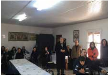
Από την κοπή πίτας στο Μονοπήγαδο