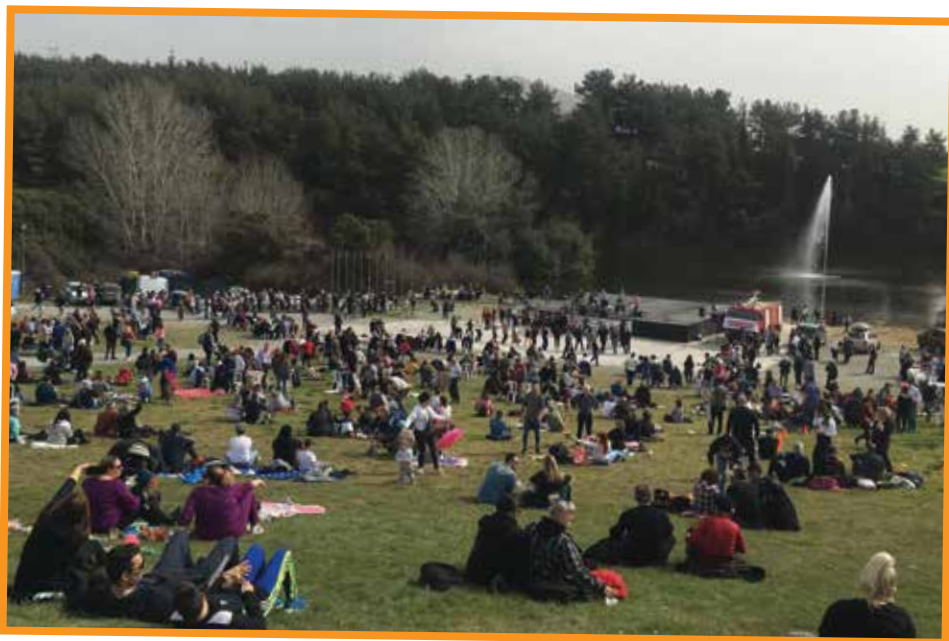
Εκατοντάδες άτομα γιόρτασαν τα κούλουμα στο Φράγμα της Θέρμης.

Μ ε τη συμμετοχή χιλιάδων πολιτών, ακόμη και από τους γύρω δήμους και το πολεοδομικό συγκρότημα Θεσσαλονίκης, γιορτάστηκαν οι απόκριες στο δήμο Θέρμης. Πολύ κόσμος προσέλκυσε την Καθαρά Δευτέρα το Φράγμα Θέρμης, αλλά αποκριάτικες εκδηλώσεις έγιναν και σε άλλες κοινότητες το διήμερο 26 και 27 Φεβρουαρίου. Στο Φράγμα της Θέρμης την τιμητική τους είχαν οι καρταετοί και τα παραδοσιακά εδέσματα. Ήθη και έθιμα της Αποκριάς αναβίωσαν στις κοινότητες Βασιλικών, Περιστεράς, Τρίλοφου, Αγίου Αντωνίου, Σουρωτής, Κ. Σχολαρίου.