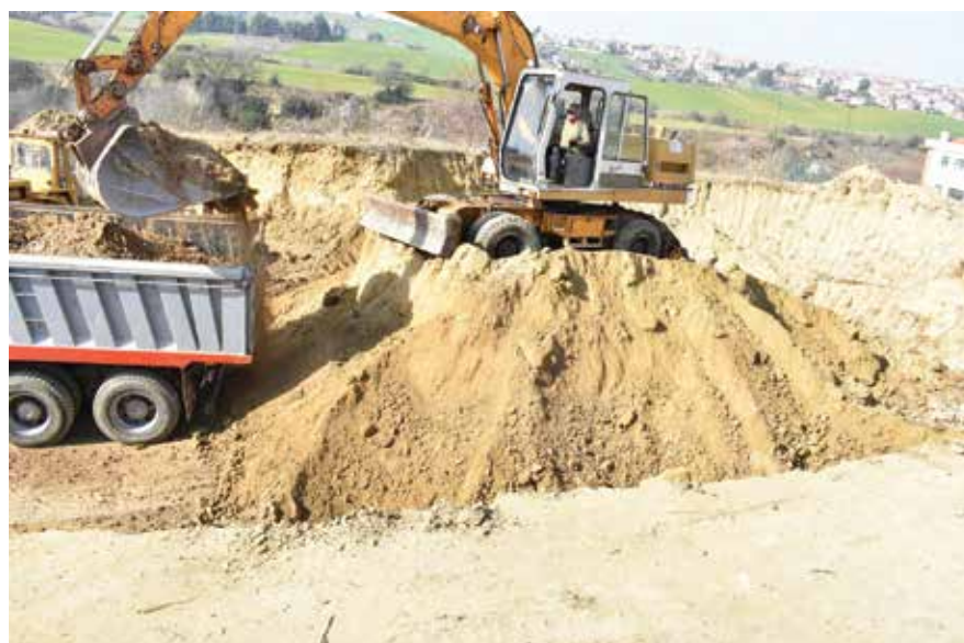
Οι εργασίες ξεκίνησαν στα μέσα Φεβρουαρίου.