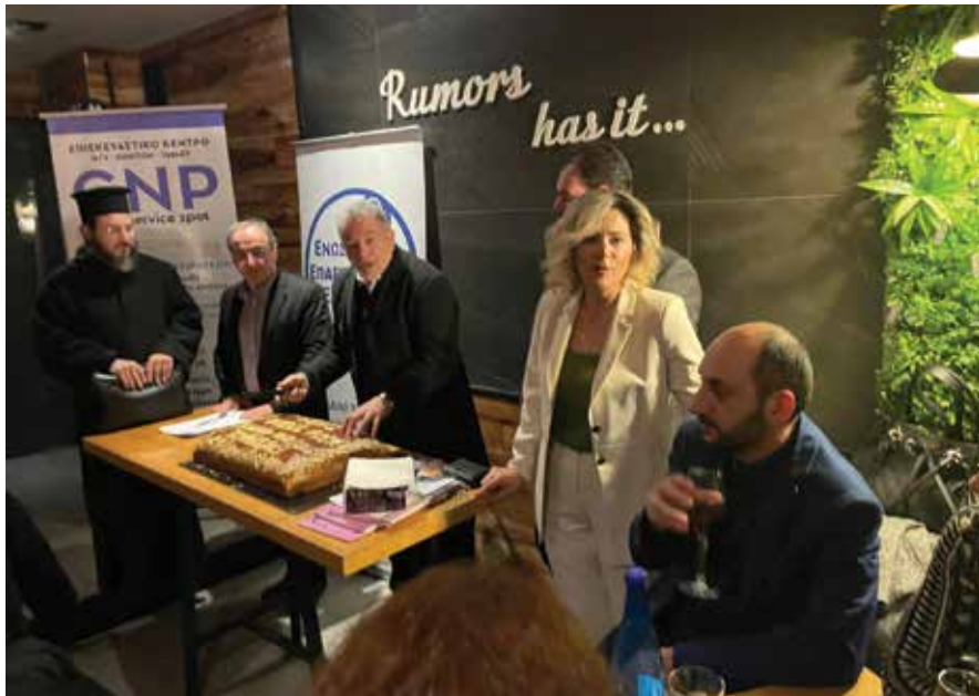
Ο δήμαρχος Θ. Παπαδόπουλος κόβει την πίτα των Επαγγελματιών Θέρμης.

Τ ην πρωτοχρονιάτικη πίτα του έκοψε την Τετάρτη 15 Φεβρουαρίου η Ένωση Επαγγελματιών Εμπόρων Θέρμης. Στο πλαίσιο της εκδήλωσης ο δήμαρχος Θέρμης Θεόδωρος Παπαδόπουλος στο σύντομο χαιρετισμό του αναφέρθηκε στις παρεμβάσεις που ξεκινούν σύντομα στο πλαίσιο του έργου του Open mall, που θα βελτιώσουν λειτουργικά και αισθητικά την αγορά της Θέρμης. «Οι παρεμβάσεις ξεκινούν σύντομα και αναμένεται να λειτουργήσουν προς όφελος τόσο των επιχειρηματιών, όσο και των πολιτών της περιοχής, αφού η δημιουργία μιας ισχυρής, ανταγωνιστικής και βιώσιμης αγοράς στη Θέρμη, θα εξυπηρετήσει τους πάντες, ακόμη και όσους ζουν κοντά στη Θέρμη». Όπως σημείωσε ο δήμαρχος «μέσω αυτού του έργου δίνεται μεγάλος βάρος στη χρήση εφαρμογών "έξυπνης πόλης και βιώσιμης κινητικότητας" και στη βελτίωση της προσβασιμότητας, της λειτουργικότητας και της αισθητικής του αστικού περιβάλλοντος της περιοχής». Παράλληλα, ο κ. Παπαδόπουλος ενημέρωσε τους επαγγελματίες ότι τις επόμενες ημέρες ξεκινά η επαναλειτουργία του υπόγειου πάρκινγκ στην πλατεία Παραμάνα το οποίο έχει αναλάβει πλέον ιδιώτης. «Η επαναλειτουργία του πάρκινγκ, στο οποίο έχουν γίνει και κάποιες αναγκαίες εργασίες θα εξυπηρετήσει το εμπορικό κέντρο της Θέρμης αφού θα δώσει τη δυνατότητα σε όσους το επισκέπτονται με το αυτοκίνητό τους, να σταθμεύουν εκεί και μάλιστα δωρεάν για την πρώτη μισή ώρα και σε πολύ χαμηλή τιμή για τη συνέχεια».