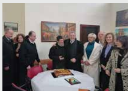
Από την εκδήλωση στο Νέο Ρύσιο

Την πρωτοχρονιάτικη πίτα τους έκοψαν τα μέλη των ΚΑΠΗ Καρδίας και Νέου Ρυσίου, την Κυριακή 5 Φεβρουαρίου 2023. Ο δήμαρχος Θέρμης Θεόδωρος Παπαδόπουλος κατά το σύντομο χαιρετισμό του σημείωσε πως «μας έλειψαν τα τελευταία χρόνια οι εκδηλώσεις μας λόγω της πανδημίας, ωστόσο αυτό αποτέλεσε μία καλή ευκαιρία να εκτιμήσουμε το ρόλο και την προσφορά των δομών αυτών, αφού σήμερα περισσότερο από κάθε άλλη φορά αναδειχτηκε η χρησιμότητα των ΚΑΠΗ και στο κομμάτι που μας αναλογεί ως δημοτική αρχή, σας διαβεβαιώνω πως οι δράσεις και τα προγράμματα ψυχαγωγίας για την τρίτη ηλικία, θα συνεχιστούν και θα ενισχυθούν. Οι πρόσφατες εκδηλώσεις για την προσφυγιά και τον τρόπο με τον οποίο στήθηκαν αυτά τα προσφυγικά χωριά από τους προγόνους μας, μας έδωσαν την ευκαιρία να θυμηθούμε ότι όλοι