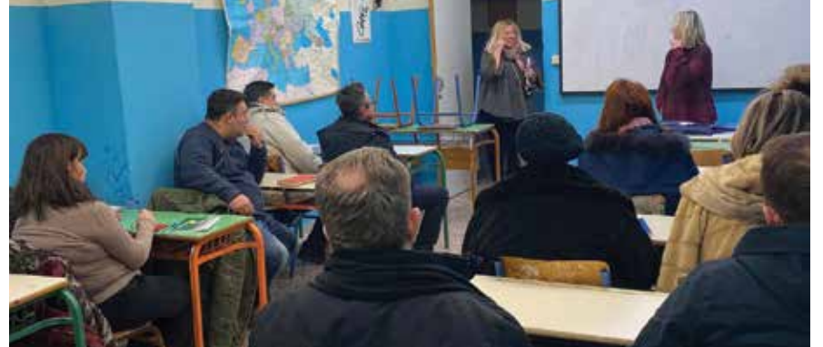
Από το μάθημα "Βασικά αγγλικά Α1" στο 1ο γυμνάσιο Θέρμης.