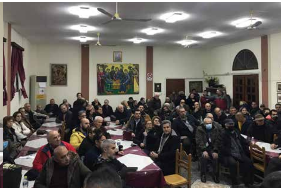
Δεκάδες ήταν οι κάτοικοι οι οποίοι συμμετείχαν στην ενημέρωση.

Σ ε αναλυτική ενημέρωση σχετικά με τη λειτουργία της Μονάδας Επεξεργασίας Απορριμμάτων στην περιοχή του Αγίου Αντωνίου (ΜΕΑ ανατολικού τομέα) προχώρησε την Πέμπτη 9 Φεβρουαρίου η δημοτική αρχή Θέρμης. Στο πλαίσιο της ενημέρωσης η οποία πραγματοποιήθηκε στο πνευματικό κέντρο Κάτω Σχολαρίου ο δήμαρχος Θεόδωρος Παπαδόπουλος διαβεβαίωσε τους δεκάδες κατοίκους που κατέκλυσαν την αίθουσα ότι η λειτουργία της ΜΕΑ δεν εγκυμονεί κανέναν κίνδυνο για το περιβάλλον και για την περιοχή καθώς δεν προβλέπεται καύση, ούτε και Χώρος Υγειονομικής Ταφής Υπολειμμάτων. Στη συνάντηση συμμετείχαν επίσης ο πρόεδρος του Φορέα Διαχείρισης Στερεών Αποβλήτων Κεντρικής Μακεδονίας Μιχάλης Γεράνης, ο μελετητής του έργου Δαμιανός Μπούρκας καθώς και στελέχη του ΦοΔΣΑ.