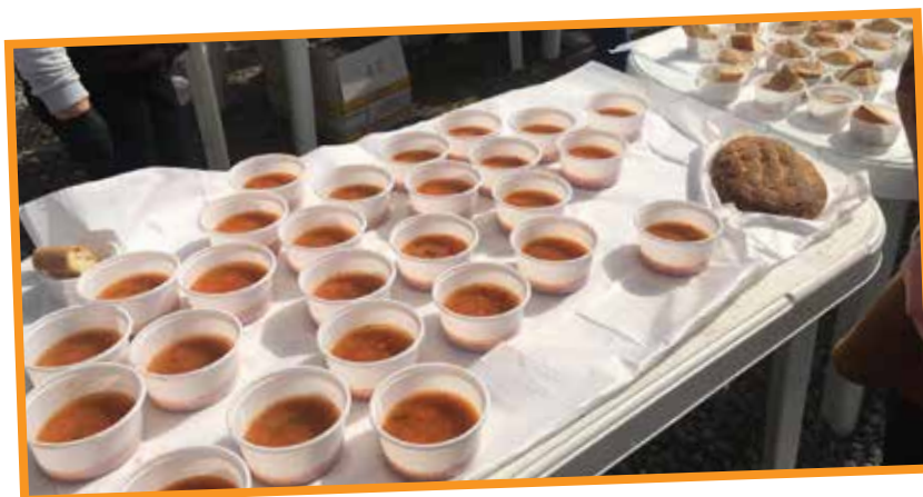
Η παραδοσιακή φασολάδα στον Τρίλοφο