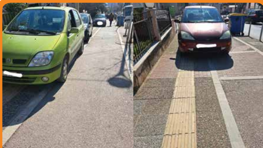
Παράνομα σταθμευμένα αυτοκίνητα στην οδό Βασ. Ταμβάκη

ΕΠΙΣΤΟΛΕΣ ΣΕ ΕΛΛΗΝΙΚΗ ΑΣΥΤΝΟΜΙΑ ΚΑΙ ΤΡΟΧΑΙΑ ΘΕΡΜΗΣ