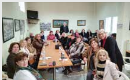
Από την εκδήλωση στην Καρδία

εσείς αποτελείται ζωντανό κομμάτι της ιστορίας μας και έχουμε την υποχρέωση να σας φροντίζουμε και να λύνουμε κάθε σας πρόβλημα».