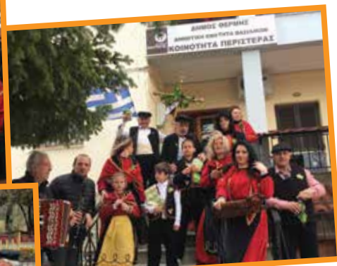
Ο παραδοσιακός γάμος στην Περιστερά ξεκινά.