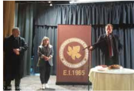
Από την κοπή πίτας στον Τρίλοφο