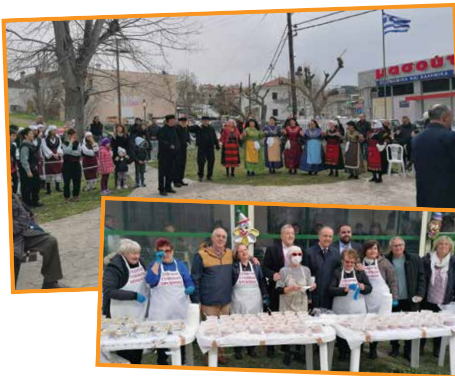
Χορός και σαρακοστιανά στον Τρίλοφο