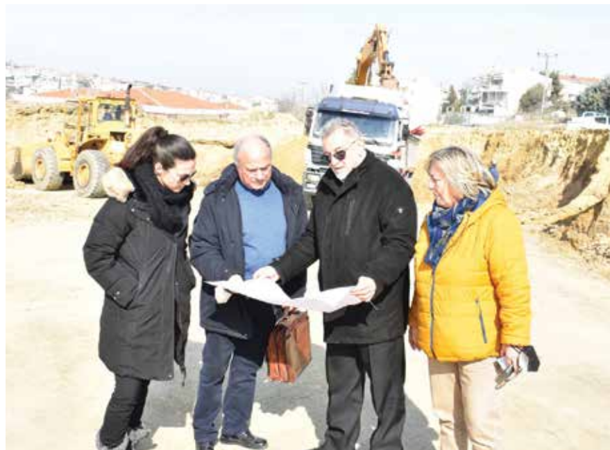
Χρειάστηκε να φτάσουμε στον 13ο πλειοδότη για να ξεκινήσει το έργο.

υλικά αλλά και στο κόστος ενέργειας. Έτσι, ενώ το έργο ήταν να ξεκινήσει τον Μάιο του 2022, χρειάστηκε να φτάσουμε στον Φεβρουάριο του 2023 για να αρχίσουν οι εργασίες». Ο δήμαρχος Θέρμης τόνισε, παράλληλα, ότι «με την ολοκλήρωση της κατασκευής του έργου, που αναμένεται σε ενάμισι χρόνο, πλέον και οι τρεις δημοτικές ενότητες του δήμου Θέρμης, θα έχουν το δικό τους, μεγάλο κλειστό γυμναστήριο. Μέχρι σήμερα, κλειστά γήπεδα τέτοιου μεγέθους έχουμε στο Τριάδι, στο Νέο Ρύσιο και στα Βασιλικά. Τώρα θα έχει γήπεδο και η δημοτική ενότητα Μίκρας. Με τον τρόπο αυτό δίνουμε τη δυνατότητα στη νεολαία μας να ασχοληθεί με τον αθλητισμό, ενώ βοηθούμε και τους αθλητικούς συλλόγους του δήμου μας να αναπτύξουν τα προγράμματά τους, προσελκύοντας ολόένα και περισσότερους νέους. Αυτός είναι και ο απότερος στόχος μας».